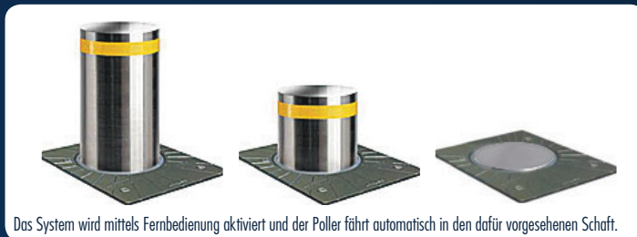
Das System wird mittels Fernbedienung aktiviert und der Poller fährt automatisch in den dafür vorgesehenen Schaft.

Unsere Produktpalette reicht hier vom einfachen Absperrpoller bis hin zu Hochsicherheitspollern, die in der Lage sind sensible Bereiche zu schützen und sogar LKWs aufzuhalten ( LKW mit ca. 7 Tonnen und einer Geschwindigkeit von 50 km/h ).